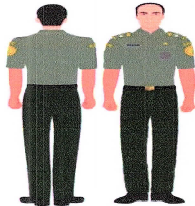
PDH Lengan Pendek Gambar 1.b